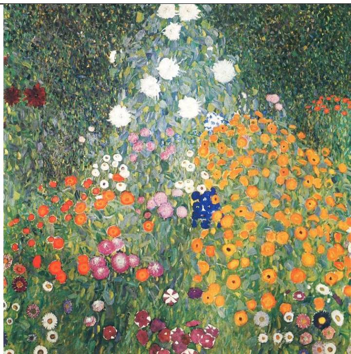
Κήπος με λουλούδια (1905) -

(Ο συγκεκριμένος πίνακας πωλήθηκε σε δημοπρασία το 2017 για 59 εκατομμύρια δολάρια!!!).