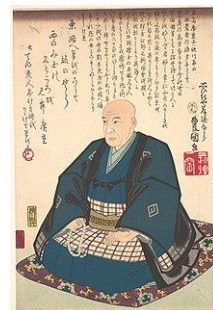
Ιάπωνας καλλιτέχνης (1797 – 1858)